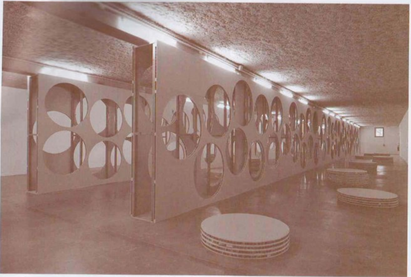
Pierre Bismuth, Quelque Chose en Moins, Quelque Chose en Plus , 2014. Vue de l'exposition «Ce qui n'a jamais été / Ce qui pourrait être», MRAC Languedoc-Roussillon, Sérignan.

Cyclo , réalisée à l'occasion de l'exposition, se compose de six caissons de bois de tailles différentes accrochés au mur ou posés au sol. Vus de l'extérieur, ils semblent être de simples caisses de transport; de face, l'on s'aperçoit qu'ils sont peints du vert Chroma Key, couleur des décors d'incrustation aux potentialités infinies, mais inutilisés. La référence formelle à la sculpture minimale est évidente mais avec une modification des « conditions de perception de l'œuvre d'art et [de] sa conceptualisation 5 », une idée qui traverse par ailleurs tout l'œuvre de l'artiste.