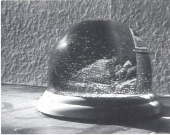
MAT COLLISHAW, Snowstorm , 1994, videoprojectie op getest glas

Sommige dingen moeten we onder ogen zien, zoals de dakloze die we tegenkomen op weg naar huis. Dat soort problemen wordt verschoven door het te incorporeren in een beeldcultuur. Zo worden ze toegankelijk gemaakt en tegelijkertijd worden ze daarmee aan het zicht onttrokken. Dat gebeurt op allerlei terreinen. Neem bijvoorbeeld de pornografie. We willen niet een foto van zo maar een man en een vrouw, maar een beeld dat tegemoet komt aan de wensen van – vooral – mannen. Een vrouw moet dan een lustobject worden. Zij mag niet zijn zoals ze eigenlijk is, namelijk gewoon een ander mens, nee, zij moet veranderen in een of andere fantastische verschijning. Dat is het beeld waar mensen in geloven.'