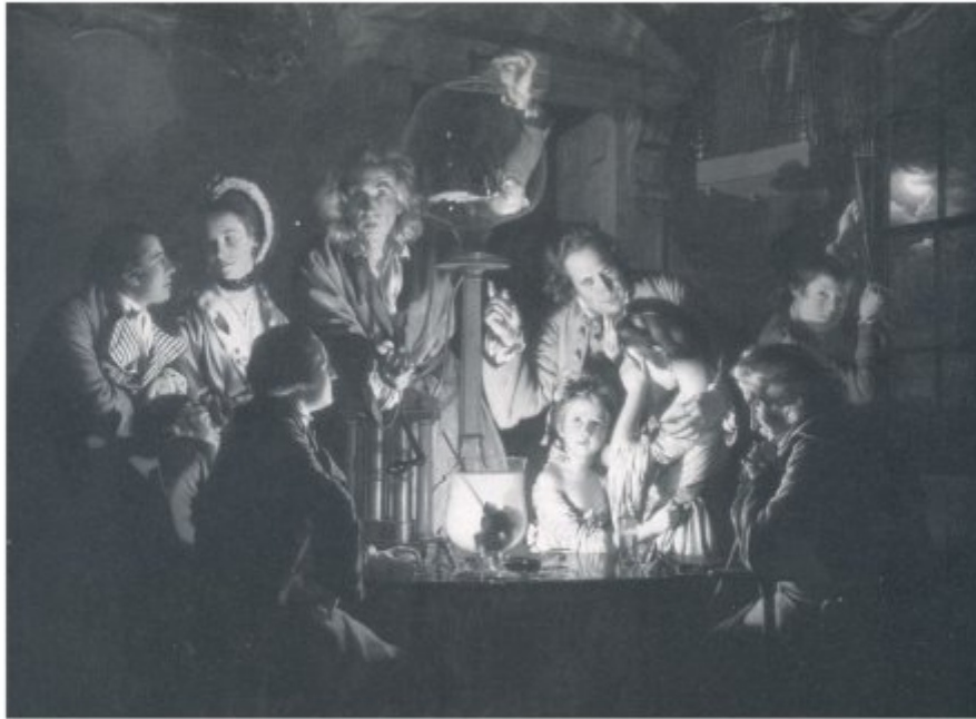
JOSEPH WRIGHT OF DERBY, An Experiment on a Bird in an Airpump , circa 1767, courtesy The National Gallery, London

In sommige werken gebruik je beelden van zeer recente films, in andere keer je terug naar de kinderjaren van de cinema. Wat boeit je daarin!