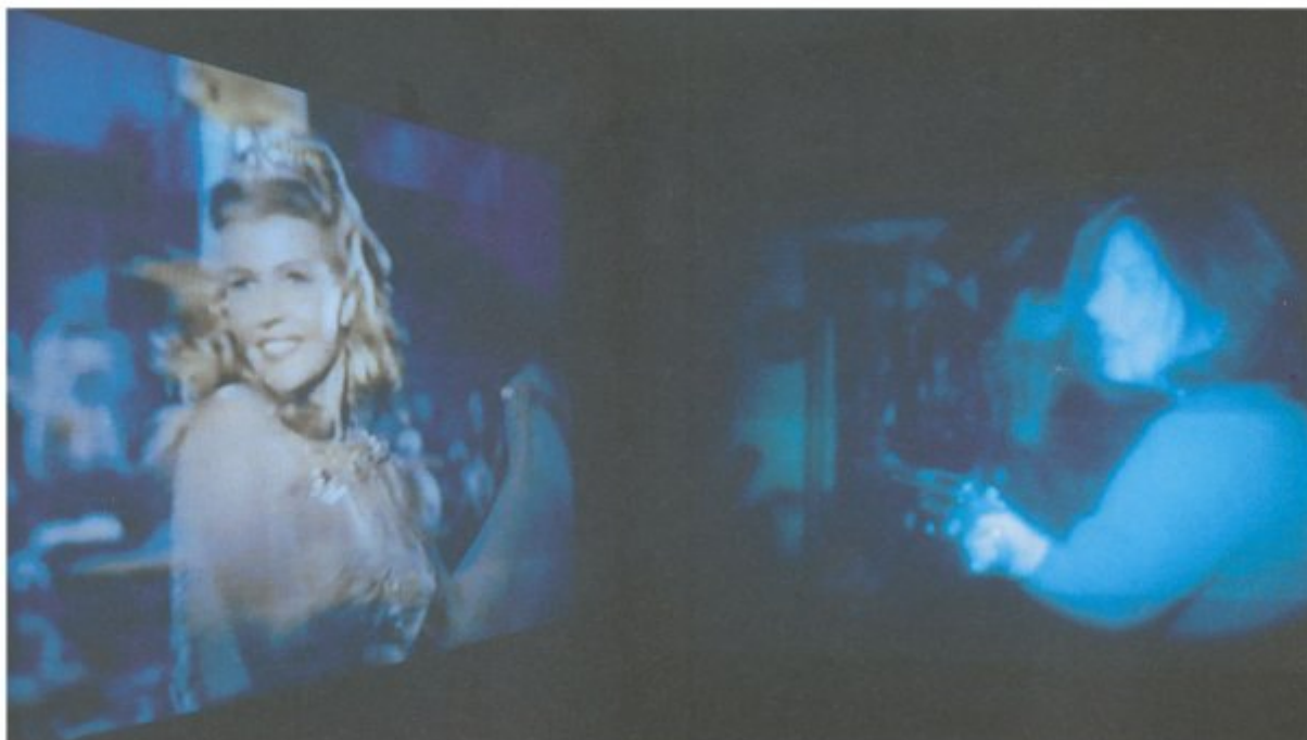
MAT COLLISHAW, Cinderella , 1995, diaprojectie met fragment uit Salome (links) en uit Silence of the Lambs (rechts), courtesy Stedelijk Museum, Amsterdam