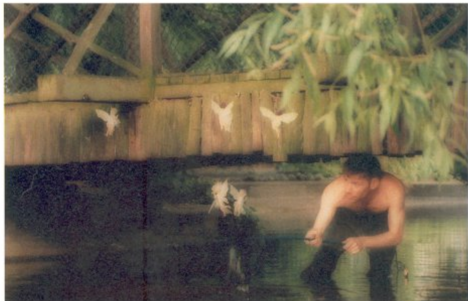
MAT COLLISHAW, Catching Fairies , 1994, ingekleurde foto, 50 x 60 cm

'Je kent die oude, Victoriaanse foto's wel van Elsie Wright, beelden van een meisje in een achtertuin, omringd door elfies. Dat zijn, zoals bekend, trucages, nepfoto's. Wat maakt die foto's