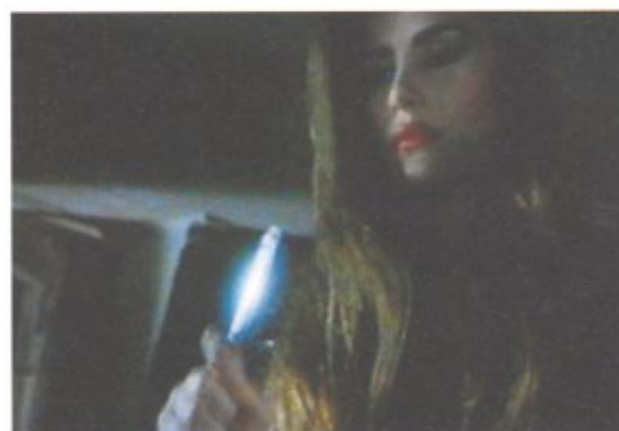
MAT COLLISHAW, Cinderella , 1995, details uit diaprojectie