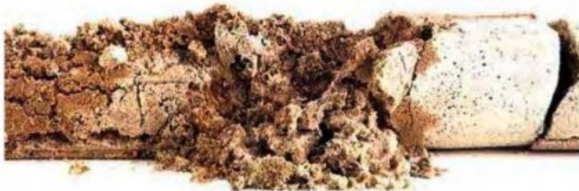
Ci-dessus : Sans titre , série We are all Astronauts aboard a little Spaceship called Earth , 2012-2013, treize globe au-dessus d'une table, minéraux, dimensions variables.