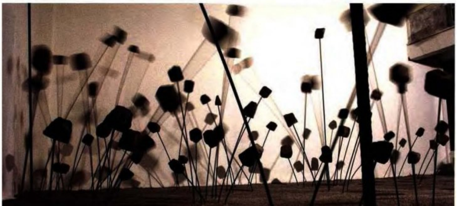
Ci-dessous : Sans titre , série Das Schilf , 2010, cent douze barres de fer, pavés provenant des rues de Berlin, 800 kg de béton, dimensions variables.