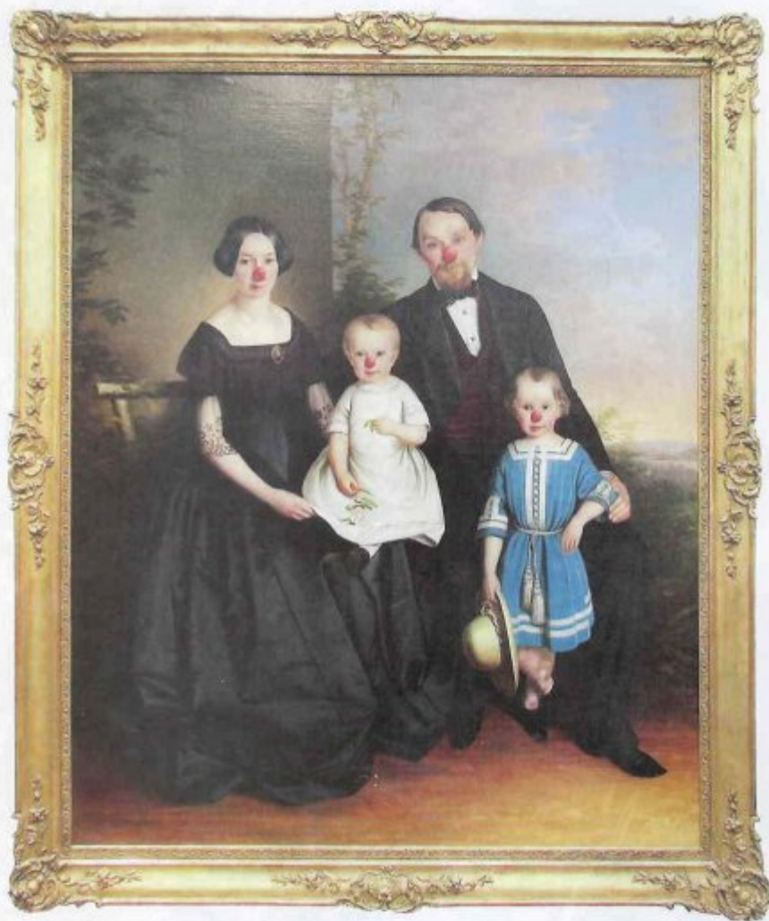
303 GALLERY, NEW YORK

Reste un hiatus au milieu de tant d'enthousiasme : difficile de définir la frontière entre (Off)icielle et la Fiac. Pourquoi reléguer aux Docks la galerie strasbourgeoise Ritsch-Fisch, qui présentait un ensemble stupéfiant d'art brut (d'Adolf Wölfli à Henry Darger), issu de la fabuleuse collection américaine Farber que ce marchand vient de racheter ? Et pourquoi gratifier du Grand Palais ces éternelles chinoises ou coréennes qui, d'année en année, présentent les mêmes stands sans intérêt ? On pourrait multiplier les exemples. Conten-