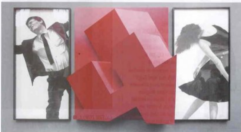
GALERIE NATALIE SEROUSSI, PARIS ROBERT LONGO New in the City , 1982-1983 En cours d'achat - entre 1 et 1,2 M€ Une œuvre rare du virtuose du dessin américain, en ce qu'elle mêle deux de ses silhouettes cultes à une sculpture abstraite, plus surprenante dans son corpus.

Voilà l'une des rares galeries qui aient tenté le stand coup d'éclat, un genre en perdition depuis quelques années.