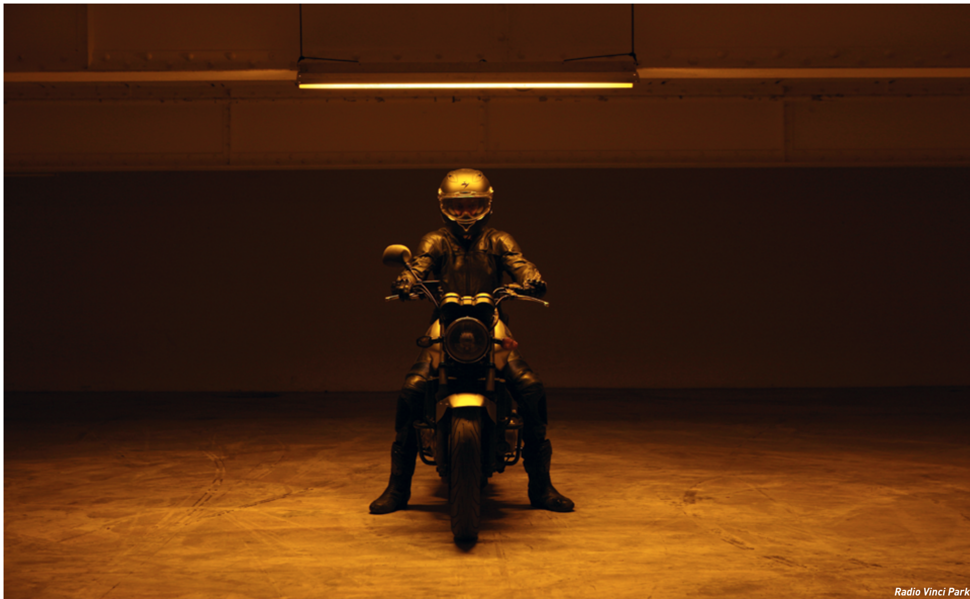
Radio Vinci Park