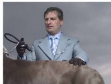
"Dog", 2001

Le azioni, sempre caratterizzate da una forte elementarità, sono riprese al rallentatore e analizzate con grande precisione attraverso una paziente scansione di primi piani, dettagli e angolazioni diverse. I décor sono essenziali e al limite dell'astrazione, mentre le immagini sono prive di sonoro eccetto che per le fredde risonanze elettroniche di Tobias Bernstrup. Gli interpreti restano in silenzio perché l'azione che si svolge sotto gli occhi dello spettatore - l'esercizio del potere, il dipanarsi di rapporti di dominio e sottomissione - è veicolata da segni e codici non verbali: il gioco di sguardi, le differenze di status e di scala gerarchica che sono spesso suggerite da una differenza d'età o da una diversa sicurezza nei gesti. L'uso insistito del dettaglio e del rallenti carica gli oggetti, gli sguardi e i gesti di significati metaforici, ma finisce spesso per esaltarne l'ambiguità semantica. Se le dinamiche di dominio e sottomissione sembrano assumere un'evidente valenza omoerotica, altri elementi, amplificati dallo sguardo della videocamera, sono successivamente accresciuti nella loro ambivalenza.