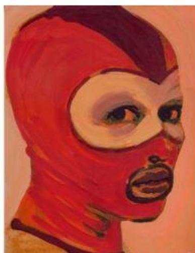
Le masque bicolore, 2015. Acrylique sur carton. 28 x 21,8 cm. S'agit-il d'un Jeff Koons?

Cela risque d'être un petit jeu amusant chez les amateurs d'art, un jeu qui peut aussi rapporter gros : deviner qui a réalisé – et acheter ensuite – des œuvres qui seront présentées sans signature. S'agit-il d'artistes mondialement connus comme le très coté Jeff Koons (58,4 millions de dollars pour sa sculpture Balloon Dog , ce qui en fait l'artiste vivant le plus cher au monde), le maître de l'outre-noir Pierre Soulages, l'artiste des néons François Morellet, l'Américaine Sheila Hicks qui brode et tisse ses œuvres, l'architecte Franck Gehry ou l'ancien street artiste Ernest Pignon-Ernest ?