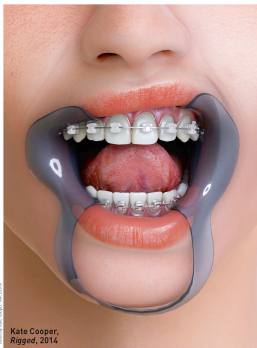
Kate Cooper, Rigged , 2014