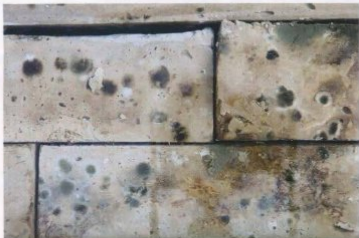
Was da wächst, ist Kunst: die Schönheit des Schimmels

zu lassen. Es hat nicht geklappt, das arme Tier ist nach zwei Monaten gestorben. Ich möchte das irgendwann als Kunstprojekt wiederholen. Bloß nicht bis zum Tod!