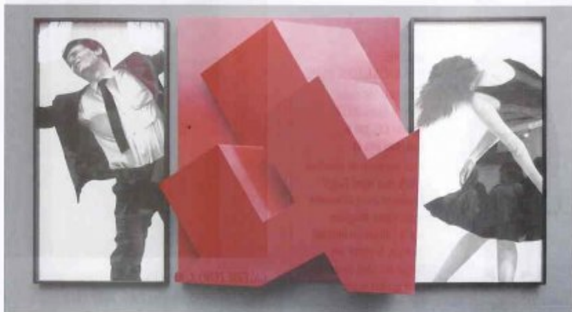
GALERIE NATALIE SEROUSSI, PARIS ROBERT LONGO New in the City , 1982-1983 En cours d'achat - entre 1 et 1,2 M€ Une œuvre rare du virtuose du dessin américain, en ce qu'elle mêle deux de ses silhouettes cultes à une sculpture abstraite, plus surprenante dans son corpus.

Voilà l'une des rares galeries qui aient tenté le stand coup d'éclat, un genre en perdition depuis quelques années.