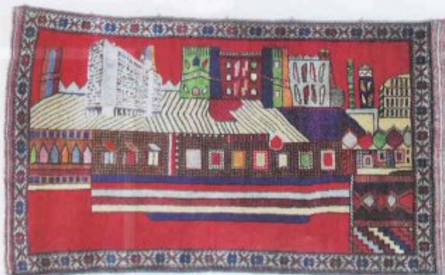
GALERIE EVA MEYER, PARIS

Toujours aussi facétieux, ce pionnier du conceptuel amusant : s'il affuble ici de nez de clown une sage famille, on l'a vu aussi déclasser un Boucher en remplaçant la belle originelle par une fille gironde exhibant ses traces de bronzage.