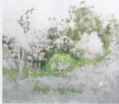
GALERIE MAX HETZLER, PARIS-BERLIN TOBY ZIEGLER Cold Comfort , 2014 Non vendu · 75 000 €

Cette huile sur aluminium s'inspire d'un paysage de Gainsborough. Dont Toby Ziegler a reproduit des versions « dégradées » trouvées via un moteur de recherche d'images. Qu'il a ensuite poncées jusqu'à en faire une abstraction.