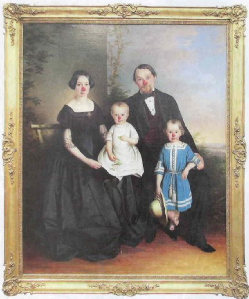
303 GALLERY, NEW YORK

Reste un hiatus au milieu de tant d'enthousiasme : difficile de définir la frontière entre (Off)icielle et la Fiac. Pourquoi reléguer aux Docks la galerie strasbourgeoise Ritsch-Fisch, qui présentait un ensemble stupéfiant d'art brut (d'Adolf Wölfli à Henry Darger), issu de la fabuleuse collection américaine Farber que ce marchand vient de racheter ? Et pourquoi gratifier du Grand Palais ces éternelles chinoises ou coréennes qui, d'année en année, présentent les mêmes stands sans intérêt ? On pourrait multiplier les exemples. Conten-