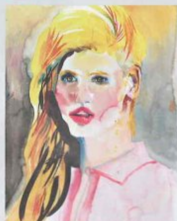
GALERIE DUKAN, PARIS-LEIPZIG JEAN-XAVIER RENAUD Salope BB , 2014 Vendu · 2 000 €