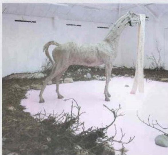
PETRIT HALILAJ Yes But the Sea is Attached to the Earth and It Never Floats Around in Space. The Stars Would Turn Off and What About My Planet? , 2014

Sentiment de fin du monde pour la belle exposition de ce jeune espoir venu du Kosovo, l'une des meilleures qui aient eu lieu en galerie pendant la Fiac : après sa vision désespérée du Muséum d'histoire naturelle muré de sa ville natale, qu'il a reconstruit l'an passé, Petrit Halilaj compose un double paysage très prégnant. Passé un buisson d'ocarinas, instrument de musique ancestral qui remonte au néolithique, le visiteur pénètre une forêt à terre, que domine un cheval glauque sur un étang d'un rose intense. Le tout sous une lumière fade qui renforce l'inquiétante étrangeté de l'ensemble.