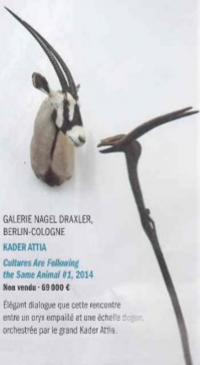
GALERIE NAGEL DRAXLER, BERLIN-COLOGNE KADER ATTIA