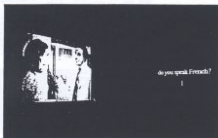
1. Pierre Bismuth lors du tournage de son dernier film, © Denis Darzacq. 2. The Party , installation, 1998, © Show Room Gallery, Londres.

la valeur que l'on porte à ces choses soi-disant construites, à l'art notamment. Je cherchais à donner de l'autorité à un acte qui a priori n'en a pas et en faire perdre à une chose qui généralement en a. »