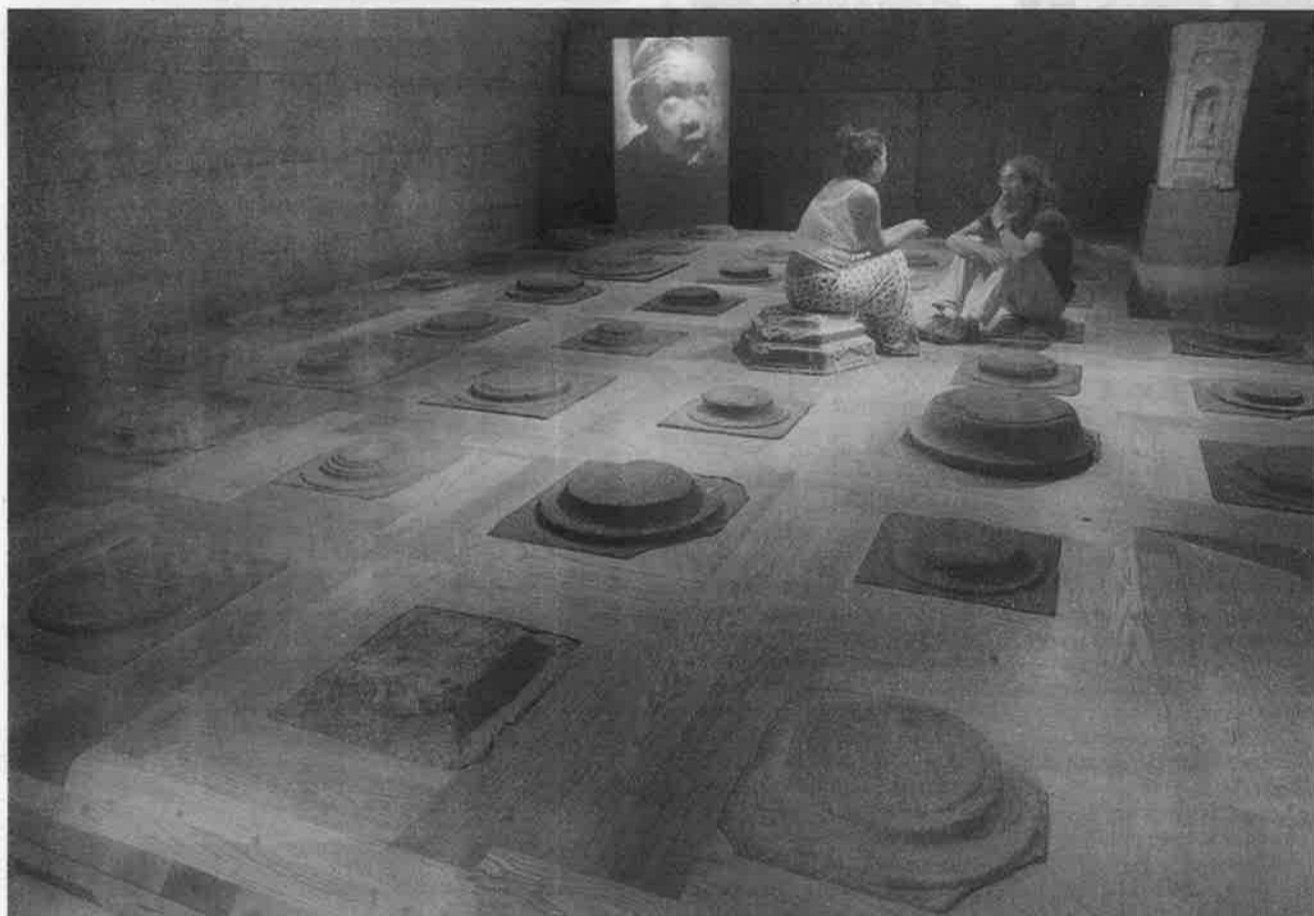
Foundation, une installation d'Ai Weiwei, est placée dans une salle du musée archéologique.

Il convient de signaler que l'entrée à la citadelle est gratuite durant la période de l'exposition, jusqu'au 17 octobre.